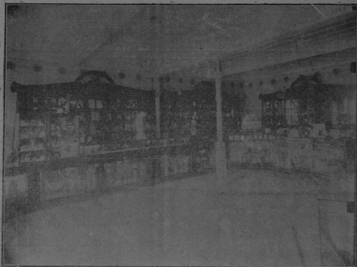
Estos son los escaparates y vitrinas de nuestra JOYERIA. Los lectores pueden apreciar con una sola mirada la riqueza, la variedad y lo CHIC y nuevo de nuestro gran surtido.

lo artístico de la confección, la riqueza de los materiales y la equidad de los precios