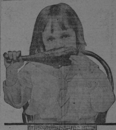
La satisfacción y la alegría de los niños es grata á ellos, á los hombres y á Dios.

Por qué será, nos preguntó un gamín, que el Niño Dios nó se acuerda de nosotros los pobres?