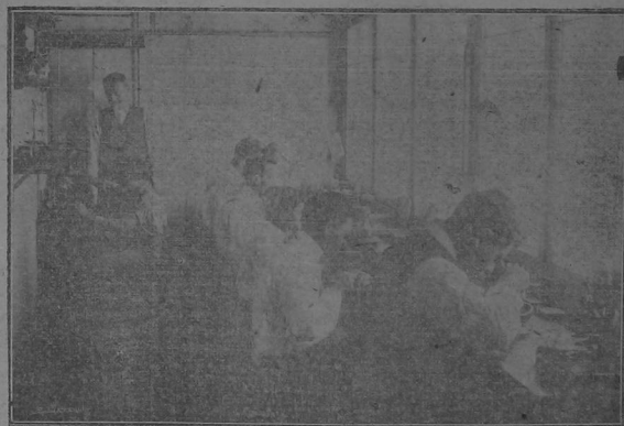
En nuestros talleres trabajan los más hábiles operarios del país, en obras de esmalte, platería, orfebrería, grabado y relojería.

Cuando piense en algo relacionado con JOYERIA, piense en ORTIZ