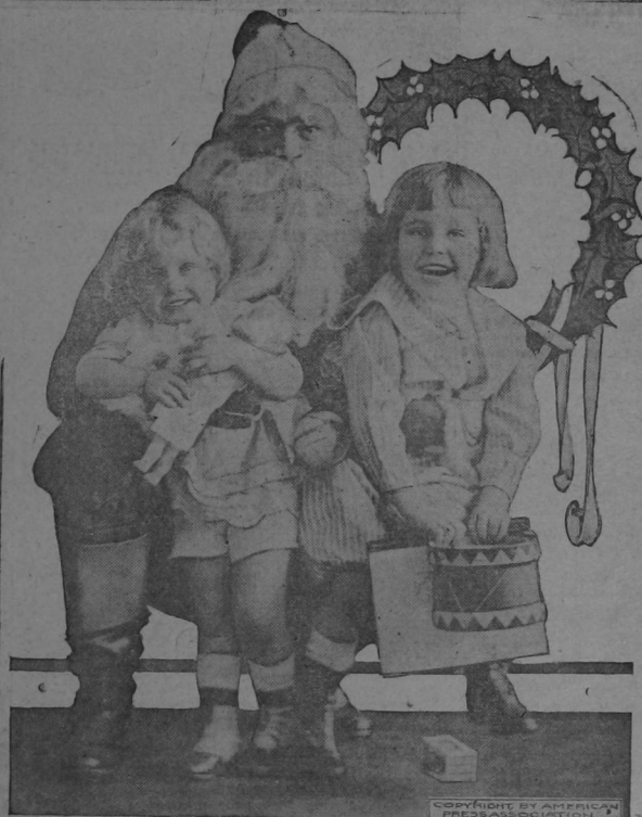
San Nicolás es un símbolo del amor á los niños. Aspiramos á imitar el ejemplo del Santo tradicional.

Imagináos: los proyectos de un chiquillo pobre que espera que su patrón le pagará. ¿Cómo va á ser su decepción cuando pase Noche Buena y su patrón